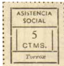
Tipo II Posiciones: 8-9-13-17-19