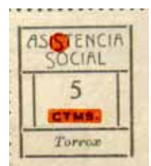
Tipo VII Posición: 20