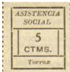
Tipo I Posiciones: 1-2-6-7-11-12-16