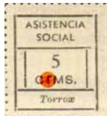
Tipo IIa Posición: 14