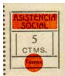
Tipo IV Posición: 5