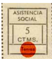
Tipo III Posiciones: 3-4