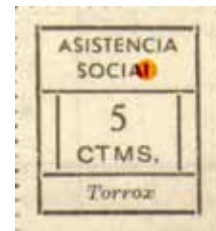
Tipo IIb Posición: 18