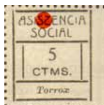
Tipo V Posición: 10