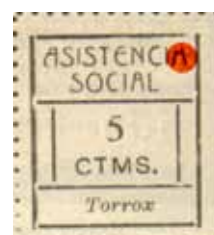
Tipo VI Posición: 15